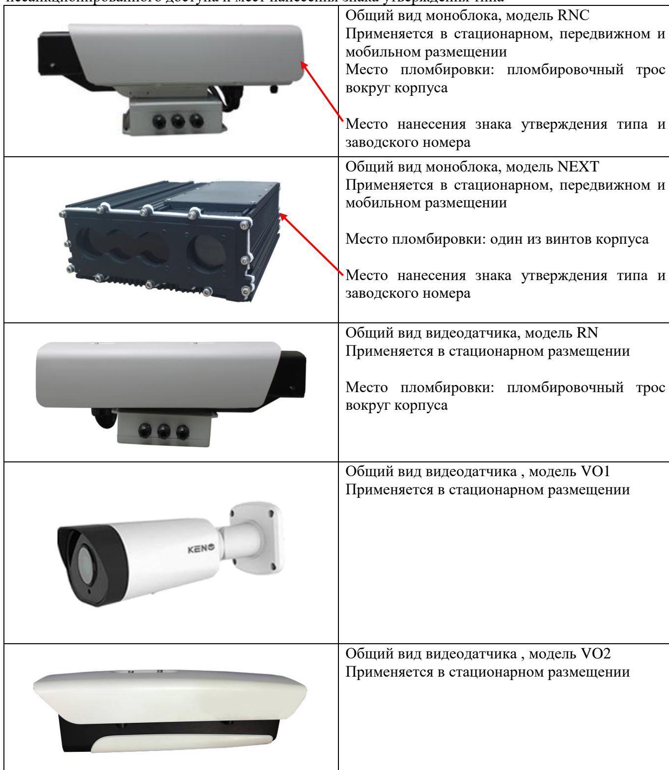
Таблица 1 – Общий вид составных частей комплексов с указанием мест пломбировки от несанкционированного доступа и мест нанесения знака утверждения типа