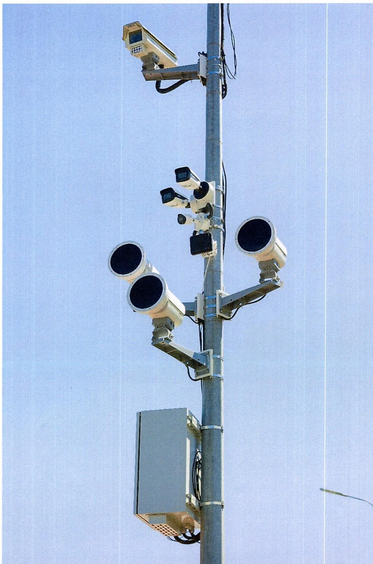
Рисунок 2. Внешний вид АПК