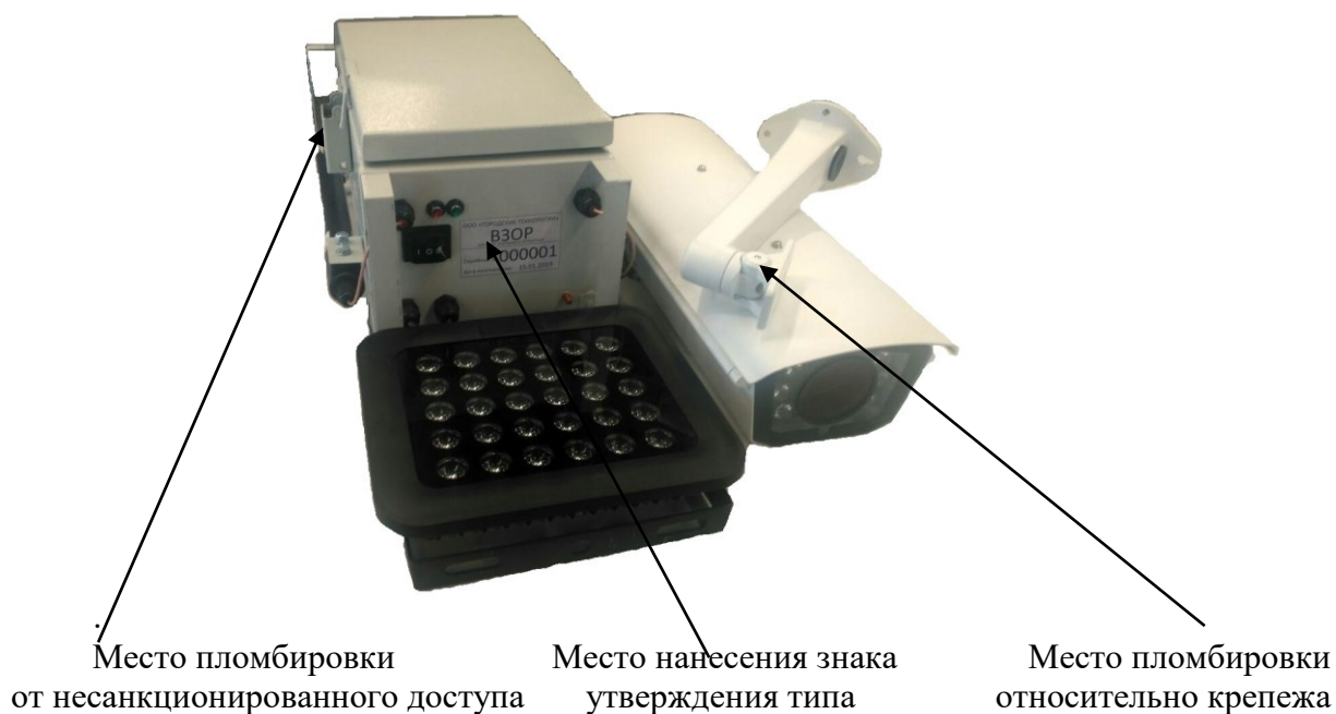
Рисунок 1 – Общий вид комплексов

Маркировка наносится на нижнюю стенку вычислительного блока. Общий вид маркировки комплексов, представлен на рисунке 2.