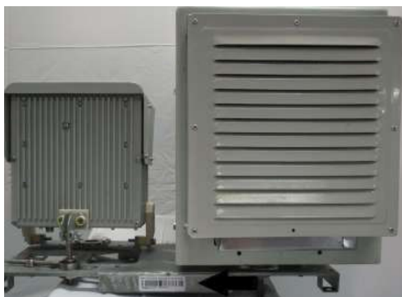
Рисунок 2 - Место нанесения знака утверждения типа