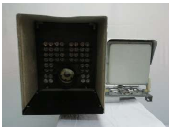
Рисунок 1 - Внешний вид комплекса с видео и радарным датчиками

Внешний вид комплекса контроля дорожного движения автоматизированного стационарного ККДАС-01СТ «Стрелка-СТ», место нанесения знака утверждения типа и место пломбировки показаны на рисунках 1, 2, 3.