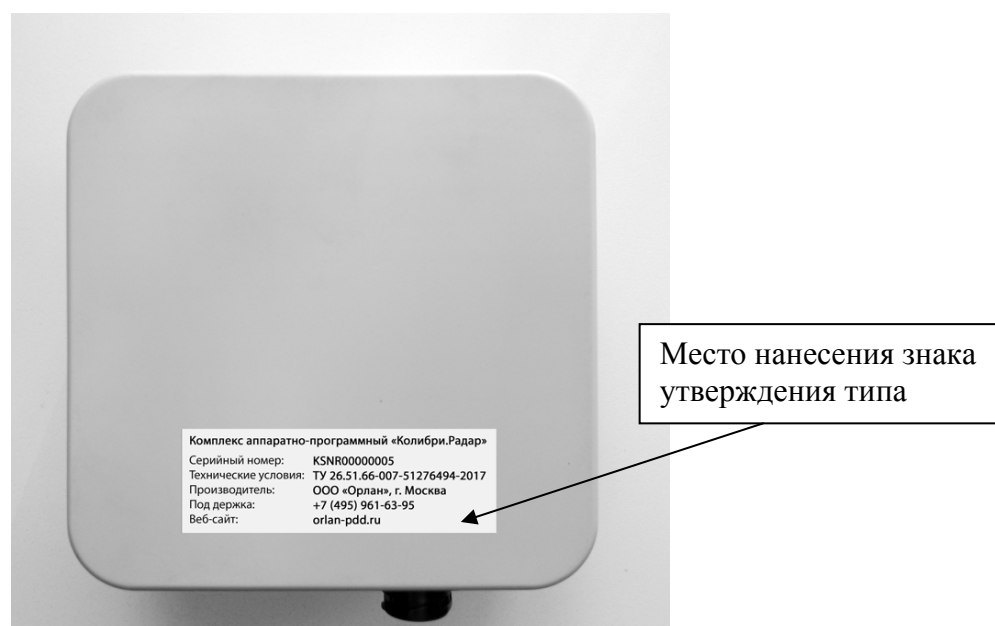
Рисунок 2 - Общий вид средства измерений сзади