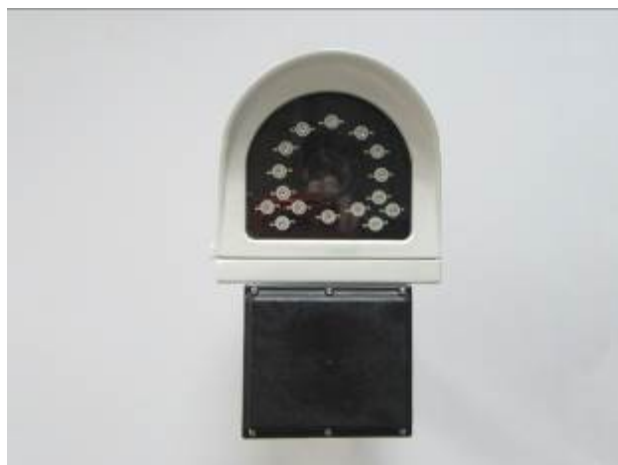
Рисунок 3 - Фронтальный вид фоторадарного блока комплексов аппаратно-программных «Орлан 2.0» (исполнение 02)