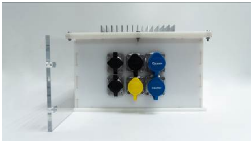
Рисунок 6 - Вид сбоку блока обработки данных комплексов аппаратно-программных «Орлан 2.0» (исполнение 02)