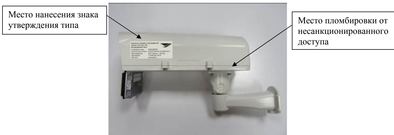
Рисунок 4 - Общий вид фоторадарного блока комплексов аппаратно-программных «Орлан 2.0» (исполнение 02)