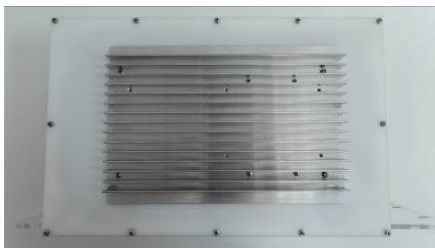
Рисунок 8 - Вид сзади блока обработки данных комплексов аппаратно-программных «Орлан 2.0» (исполнение 02)