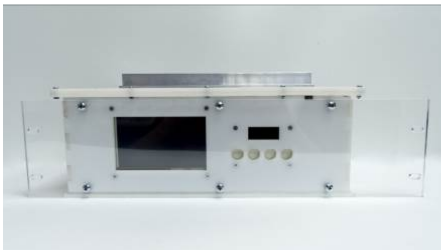
Рисунок 7 - Вид сбоку блока обработки данных комплексов аппаратно-программных «Орлан 2.0» (исполнение 02)