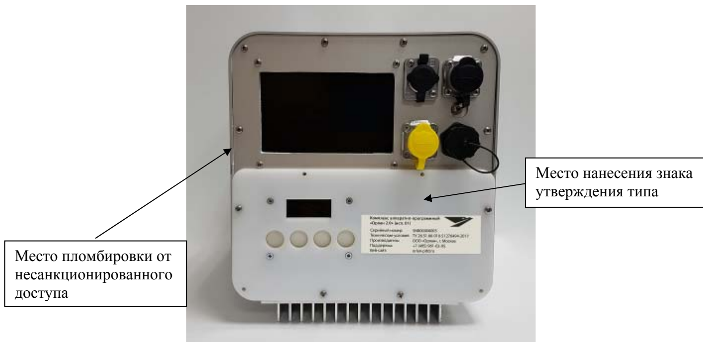
Рисунок 2 - Вид сзади комплексов аппаратно-программных «Орлан 2.0» (исполнение 01)