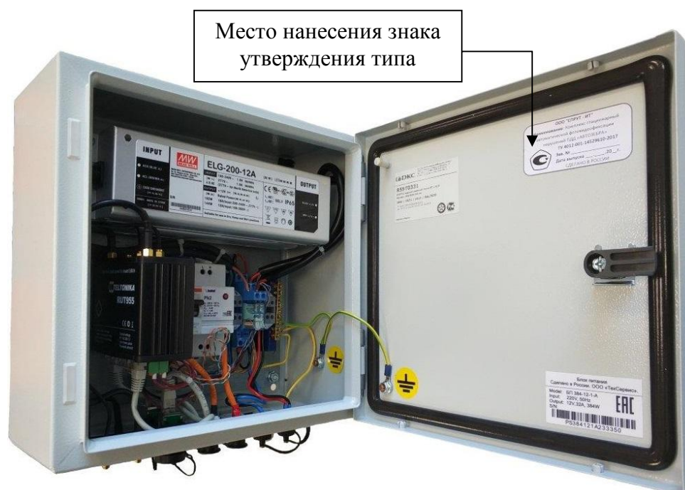
Рисунок 2 – Общий вид блока питания