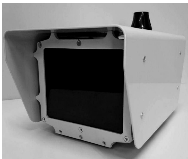
а) Вид спереди