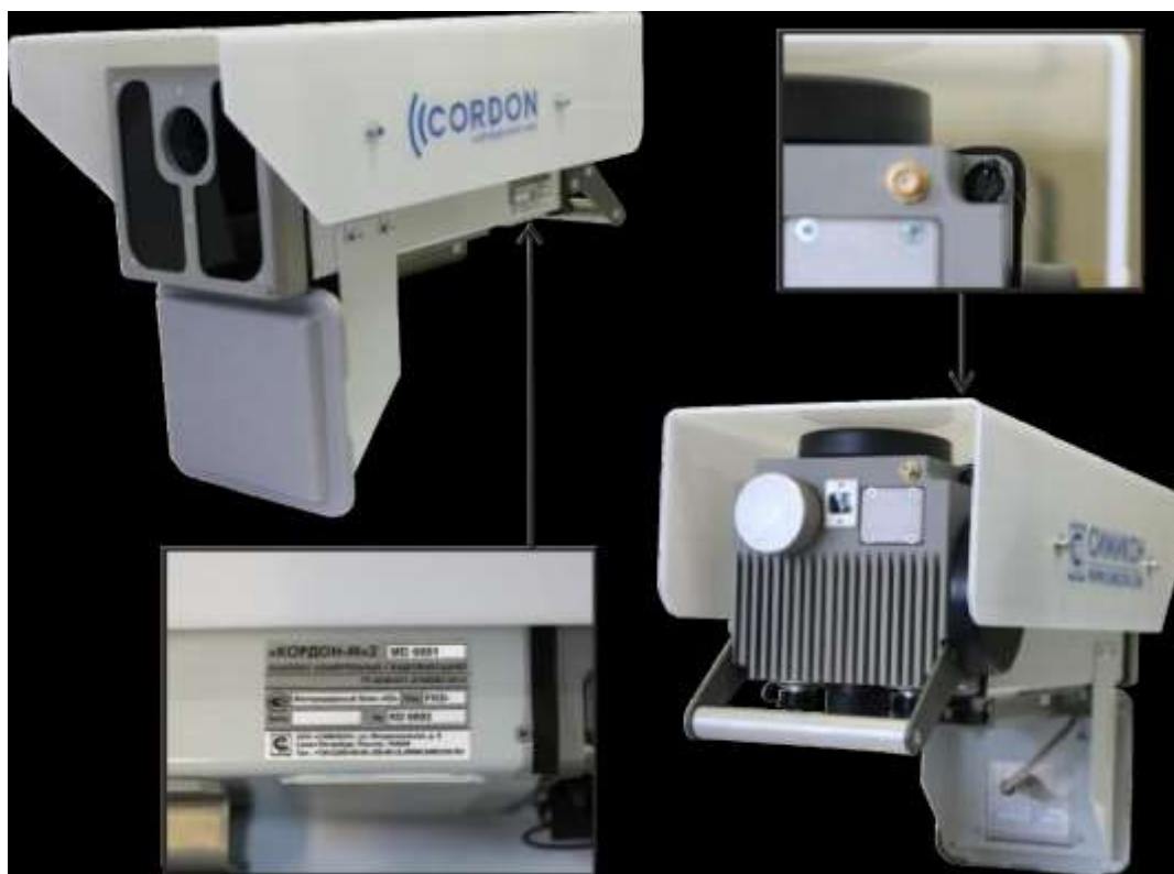
Рисунок 1 - Комплекс «КОРДОН-М»2 на базе блока «К2»

Общий вид и способ пломбирования ФБ комплексов показан на рисунках 1 - 3 (стрелкой обозначено место установки пломб).