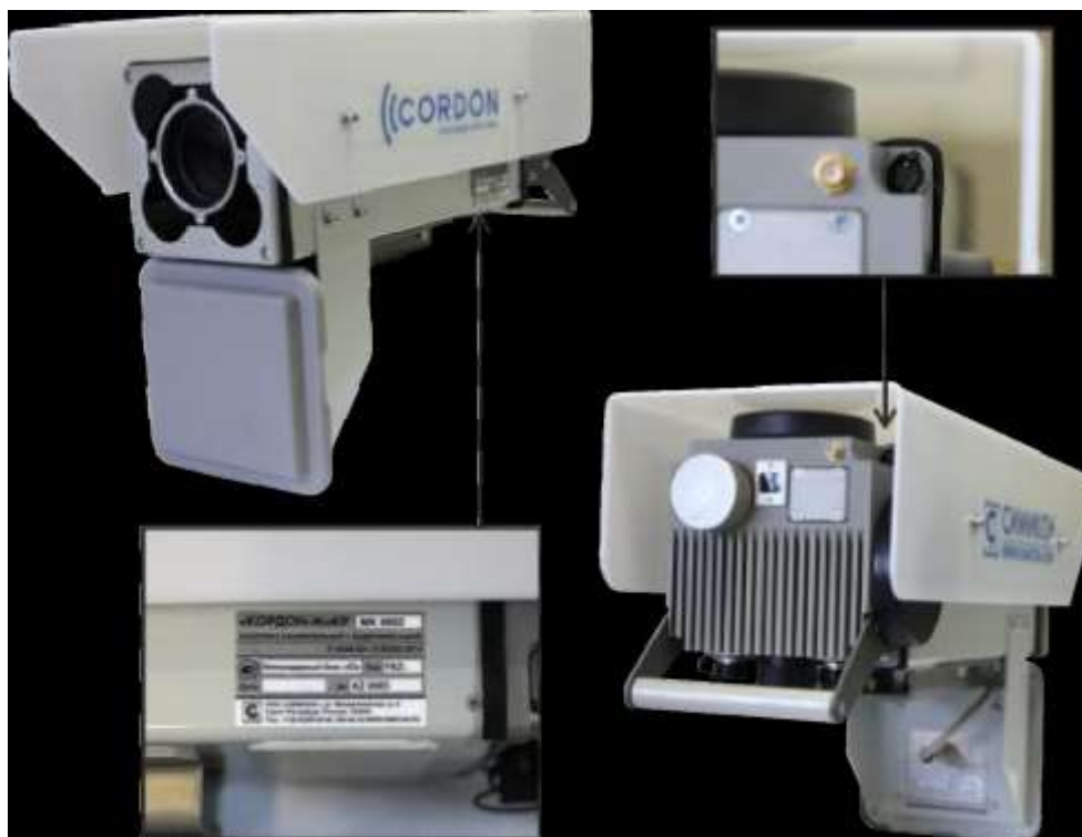
Рисунок 3 - Комплекс «КОРДОН-М»КР на базе блока «К3»