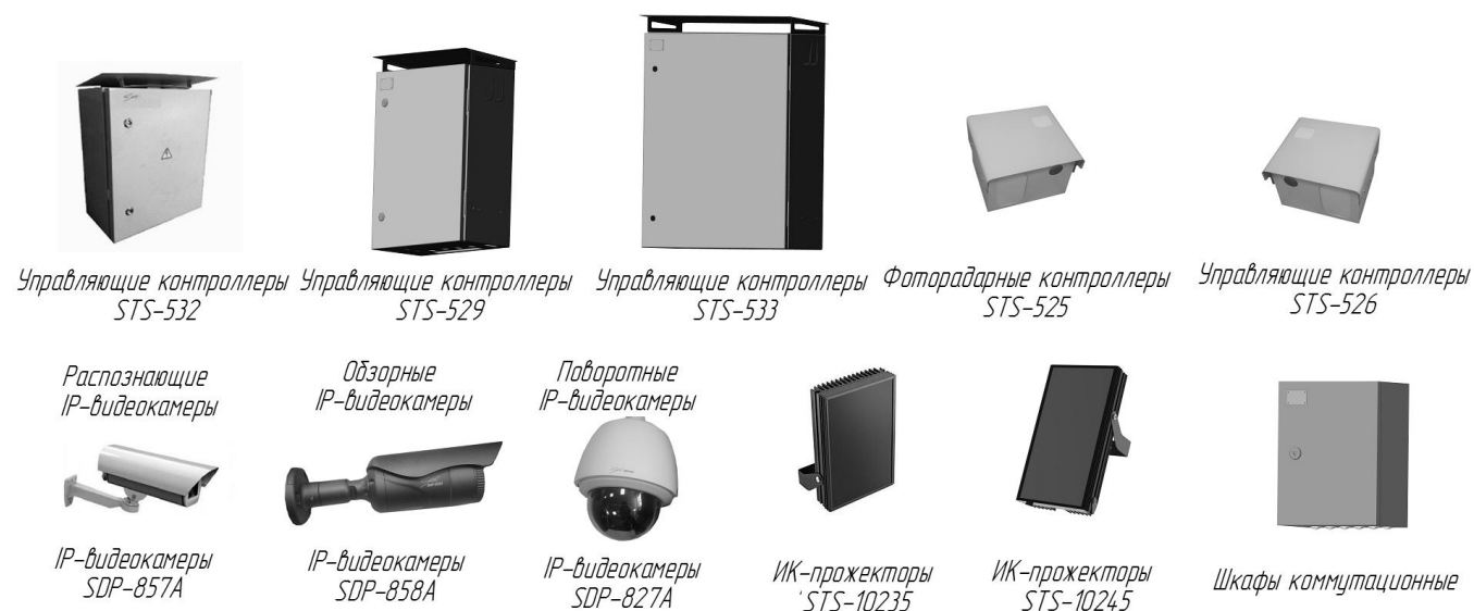
Рисунок 1 - Общий вид составных частей систем и комплектация для автоматической фиксации нарушений правил дорожного движения

Общий вид систем, возможные варианты размещения и комплектации представлен на рисунке 1.