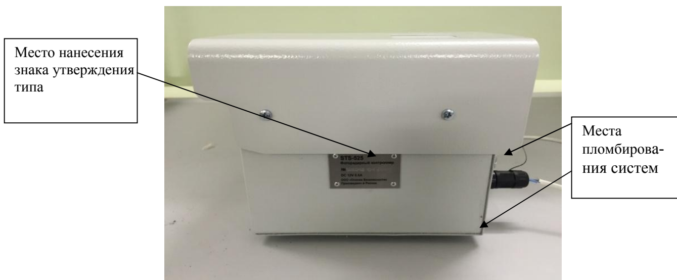
Рисунок 3 - Схема пломбировки от несанкционированного доступа и места нанесения знака утверждения типа фоторадарных контроллеров и контроллеров с функцией фотофиксации

Схема пломбировки от несанкционированного доступа и места нанесения знака утверждения типа фоторадарных контроллеров и контроллеров с функцией фотофиксации представлена на рисунке 3.